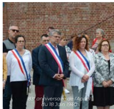
83 e anniversaire de l'Appel du 18 Juin 1940