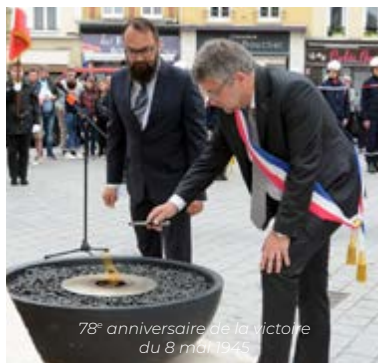
78 e anniversaire de la victoire du 8 mai 1945