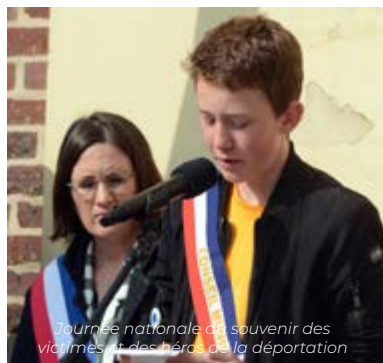
Journée nationale du souvenir des victimes et des héros de la déportation

Retours sur la cérémonie de la " Journée nationale du souvenir des victimes et des héros de la déportation ", sur la commémoration du 78 e anniversaire de la victoire du 8 mai 1945 et du 83 e anniversaire de l'Appel du 18 Juin 1940.