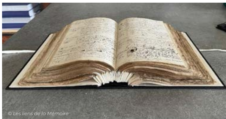
© Les liens de la Mémoire